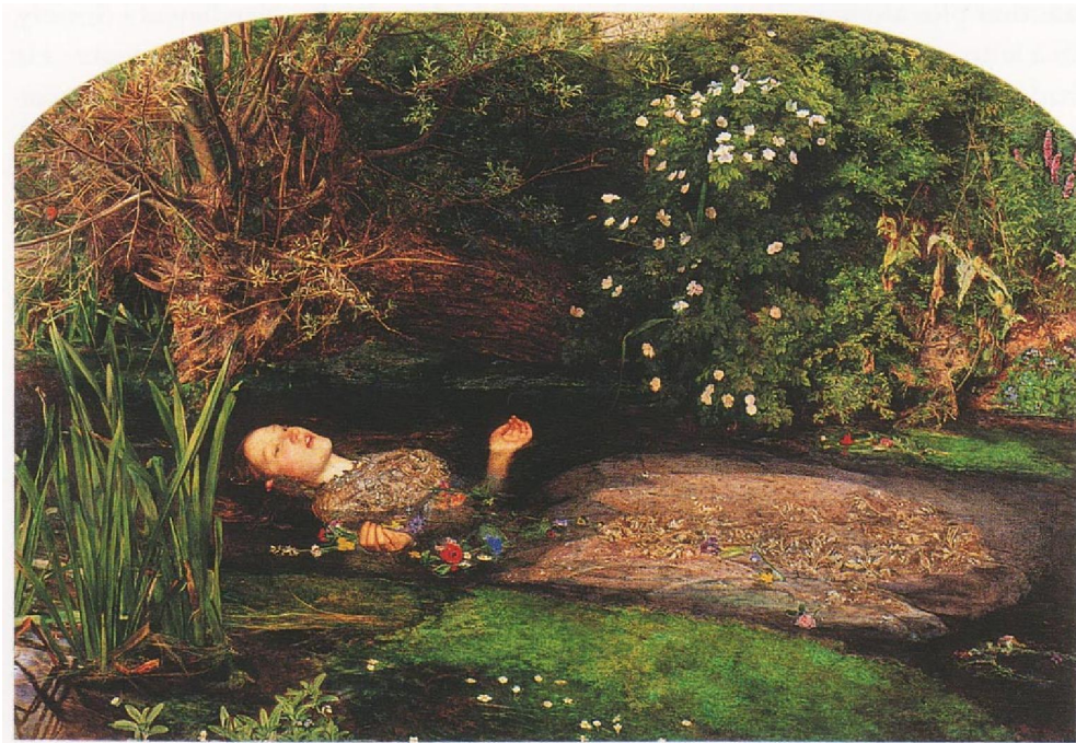
John Everett Millais – Ophelia. 1851-52. Óleo sobre tela. 76,2 x 111,8 cm. Londres. Tate Gallery.

O sentimento romântico também atravessa a obra do pré-rafaelita John Everett Millais, porém a partir de uma minuciosa e precisa observação da natureza. Em sua técnica quase fotográfica, ele nos apresenta em sua representação de Ofélia de Shakespeare uma cena banhada de sonho e espiritualidade. Sua Ofélia bóia belíssima em uma espécie de transe sobre as águas do rio que irá tragá-la. Sua fragilidade e efemeridade dominam a poética cena. Obviamente, trata-se da representação de uma morte bela e idealizada. Sua flutuação, ressaltada pela leveza do vestido e de sua posição corporal confere uma conotação espiritual à cena, cuja personagem encontra-se num estágio intermediário entre a vida e a morte. A precisão de detalhes com que Millais pinta a cena chega a impressionar até botânicos. Ao mesmo tempo que a arte dos pré-rafaelistas comunga com o espírito de observação científica da época, ela busca uma volta as tradições da pintura e um certo preciosismo saudosista.