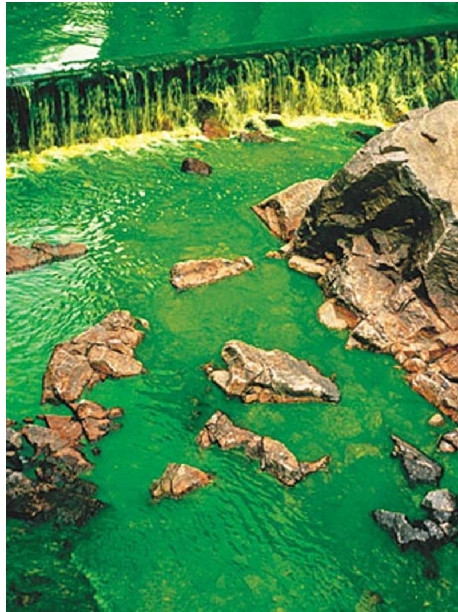
Olafur Eliasson Sem título, 1998

Entre os trabalhos mais conhecidos de Eliasson estão as intervenções que ele realiza com pigmento verde sobre diversos rios. O artista tingiu rios dos Estados Unidos, Suécia, Alemanha e outros países com pigmentos não nocivos à natureza utilizados por cientistas para marcar as correntes marítimas. A estranha cor verde fosforescente destes rios, por um lado remete a uma exacerbação das belezas naturais, por outro lado surge aos olhos como extremamente artificial. Se na contemporaneidade a contemplação do sublime da natureza idealizada dos românticos tornou-se impossível, Eliasson atualiza esta questão introduzindo um sublime artificial que surge como crítica à distância do homem atual do mundo natural e à institucionalização da arte.