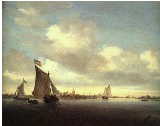
Salomon van Ruysdael – Marinha. 1650 Óleo sobre Tela, New York, Metropolitan Museum of

o espraiamento das águas. A linha do horizonte é rebaixada e os rios são retratados não mais por inteiro e serpenteantes, mas seccionados pelas bordas do quadro, sugerindo o seu prolongamento pelas laterais. Pode-se dizer que a profundidade perspectívesca acentuada do renascimento é substituída pela amplidão do espaço. A água é aqui retratada de forma mais objetiva e menos religiosa. A paisagem banhada de água serve de palco para a representação das atividades diárias da vida mundana. Esta água serve para a pesca, para o transporte de mercadorias, para a diversão e o desenvolvimento das atividades sociais. O que se celebra aqui é a proximidade do homem comum com a natureza, que lhe serve como meio para subsistência, fonte de prazer e cenário para a vida. Artistas como Salomon van Ruysdael, Willem van de Velde e Jan van Goyen desenvolvem o gênero da pintura de paisagens. Em seus quadros pode-se ver tanto cenas em que a cidade e a natureza aparecem banhadas pelos rios, como as típicas marinhas, com seus barcos a vela. Os rios e mares aqui retratados aparecem enquanto água navegável e próxima do ser humano, sem ter necessariamente uma presença religiosa tão forte.