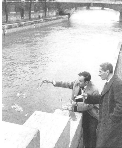
Yves Klein Ritual de entrega de uma Zona de Sensibilidade Imaterial. 26/01/1962 Na foto juntamente com Dino Buzatti . Ação sobre o Rio Sena em Paris.

A arte contemporânea traz consigo a vontade do artista de interferir diretamente sobre o mundo ao invés de apenas retratá-lo. Assim, a natureza e seus materiais tornam-se elementos que podem ser manipulados pelo artista através de ações e instalações, que podem ser apresentadas ao vivo ou documentadas por meio de fotografia, vídeo, texto ou desenhos. Entre os artistas mais representativos do início da arte contemporânea, destaca-se pela amplitude e profundidade de sua obra, o francês Yves Klein.