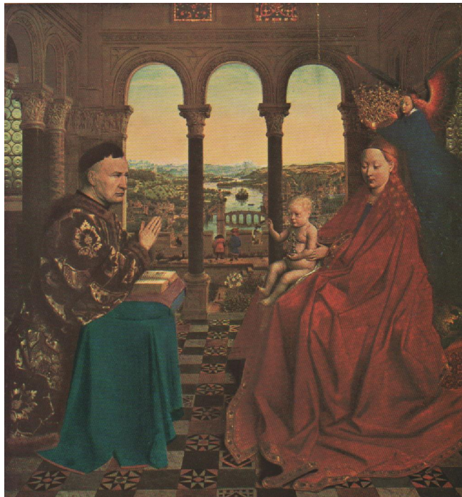
Jan Van Eyck . A Madona do Chanceler Rolin. cerca de 1453.

A constituição de um espaço simbólico no qual a idéia dos rios como artérias da terra é apresentada pode ser observada também na obra "A madona do Chanceler Rolin" de Jan van Eyck. Novamente o rio origina-se no ponto central mais distante do plano de fundo de quadro, serpenteando em direção ao primeiro plano. Esta pequena paisagem de fundo é porém interrompida por um pórtico que delimita o espaço da sala onde se encontram a Virgem com o Menino Jesus à direita e o Kanzler à esquerda. O palácio no qual se desenvolve a cena teria que ter sido construído praticamente sobre o rio para que se pudesse ter uma vista da paisagem como aquela, o que para a arquitetura da época ainda seria impossível. Observa-se aqui uma representação muito mais baseada na constituição de um espaço simbólico, do que uma busca de fidelidade à realidade.