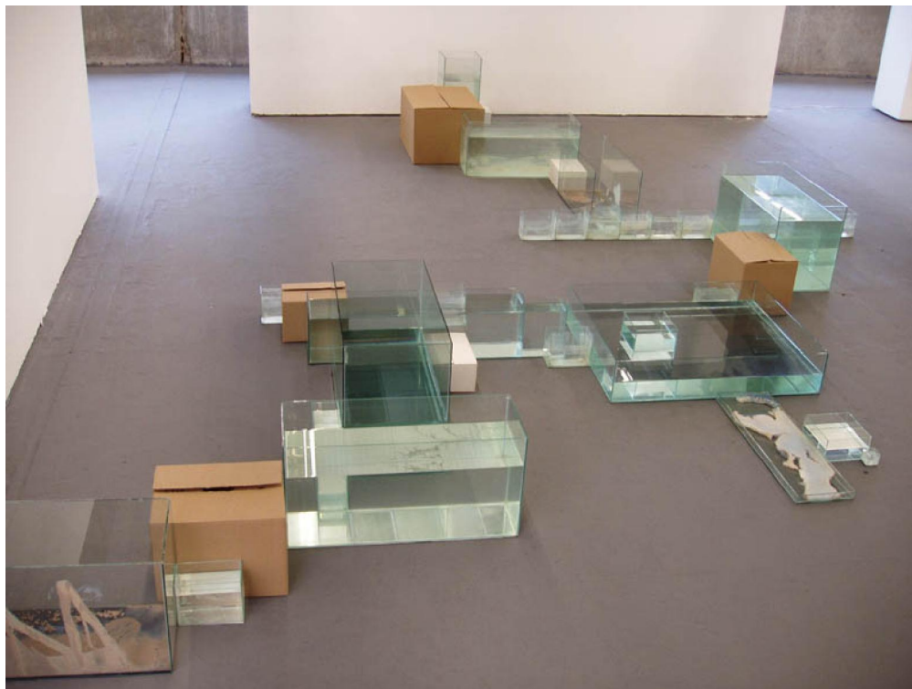
Hugo Fortes. Onde. 2006 Instalação: vidro, água, caixas de papelão, argila, parafina, plástico comido por cupins. aprox. 500 x 400 x 90 cms Centro Cultural São Paulo, Brasil

Ao invés das margens de argila que davam uma certa unicidade aos trabalhos "Ribeirão" e "Pirapora", optei em "Onde" por uma fragmentação maior e um esvaziamento visual das caixas de vidro. Enquanto nos trabalhos anteriores busquei uma limpeza cristalina da água e das paredes de vidro dos aquários, no trabalho "Onde" incorporei restos de argila, parafina e cal deixados pelo uso dos aquários, demonstrando suas marcas do tempo e seu desgaste. Incluí também alguns novos elementos. O mais marcante foram caixas e caixotes de papelão nas cores parda e branca.