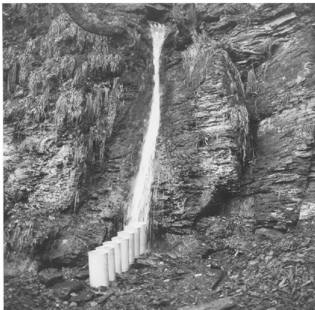
Klaus Rinke – Die Quelle - Zeiffluß Ação com 7 tonéis. Apresentação em série de fotografias (24 x 18 cm e 100 x 70 cm) 1970. Kettwig, Alemanha

É interessante notar que a utilização de rios, lagos e outras paisagens aquáticas para a realização de exposições e eventos artísticos tem se tornado tradição em algumas cidades européias. Durante minha vivência na Alemanha (2004-2006), pude encontrar vários exemplos de eventos deste tipo, como: o projeto Overtures: über Wasser , desenvolvido pela curadora Inge Lindemann nas cidades de Munique e Gelsenkirchen, o projeto Water Kunstwandelroute in de Amsterdamse Waterleidingduinen na Holanda e o projeto Kunst im Wasser , realizado anualmente na cidade de Lauf na Alemanha. Este tipo de exposição oferece uma interessante possibilidade de integração entre a natureza, o espaço público e a arte atraindo diversos tipos de público. A consciência social sobre o meio ambiente na sociedade européia e a relação menos distanciada entre a arte e as instituições políticas favorecem este tipo de iniciativa. Infelizmente no Brasil isto ainda está longe de se tornar realidade, mas paulatinamente tem aumentado, ao menos entre os artistas, o interesse e a discussão das questões relacionadas à natureza e à paisagem.