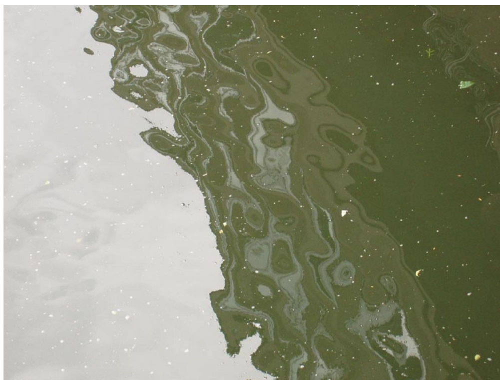
Hugo Fortes Série Reflexos. Fotografia. 2005