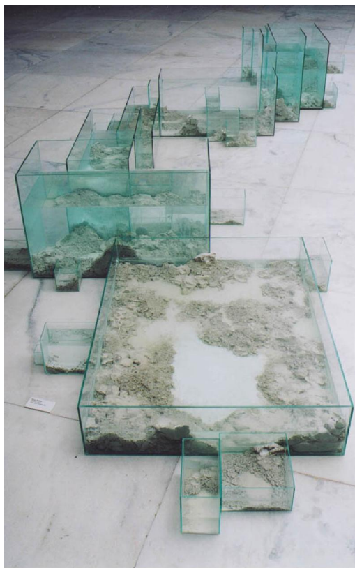
Hugo Fortes. Pirapora. 2003 Instalação: vidro, água, argila e cal. 550 x 200 x 90 cm. Memorial da América Latina, São Paulo, Brasil

O terceiro trabalho desta série foi realizado três anos depois, após minha vivência em Berlim. O trabalho "Onde" apresenta uma série de elementos novos em relação aos anteriores. Ao invés de estar solto no espaço, o trabalho inicia-se e termina nas paredes que o contém, integrando toda a sala em sua constituição. Sua distribuição assemelha-se à sinuosidade de "Pirapora", porém apresenta-se ainda mais serpenteante, fragmentada e entrecortada. Seu caminho isola determinadas áreas da sala, descrevendo uma barreira ao espectador, que deve seguir seu curso para poder observá-lo.